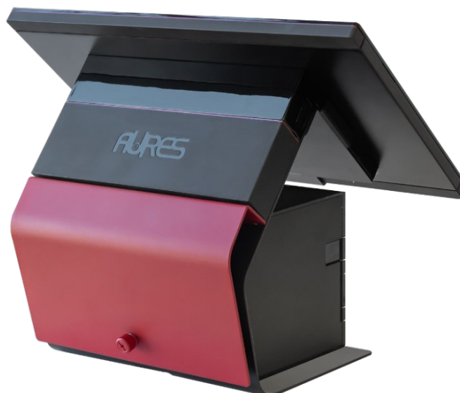
Mini-Pack "tout-en-un" TWIST-P (vue de ¾ dos) avec imprimante positionnée sous l'écran