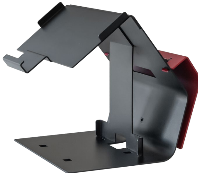
Exosquelette TWIST-P (support du TPV et de l'imprimante associée)