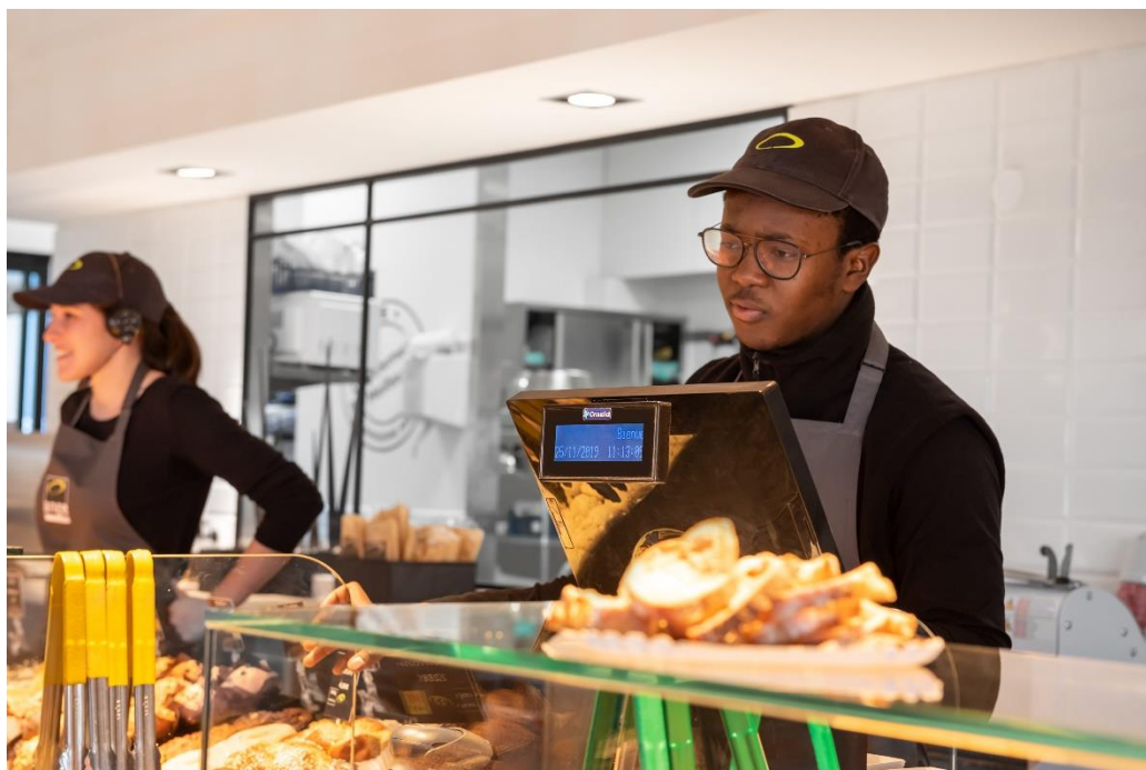
La Boulangerie ANGE de Lisses a ouvert le 6 novembre dernier.